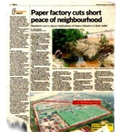
StarMetro's report on Aug 31.

An application to build a 9m-high sound barrier costing RM3.5mil had also been made to TNB, while the hostel would be demolished in stages.