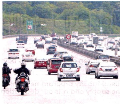
Malaysians should remain vigilant to avoid creating new clusters from their travels

"Although laws have been somewhat relaxed for interstate travelling, we should not take it for granted. Let us take care of each other, no matter where we are," he told The Malaysian Reserve recently.