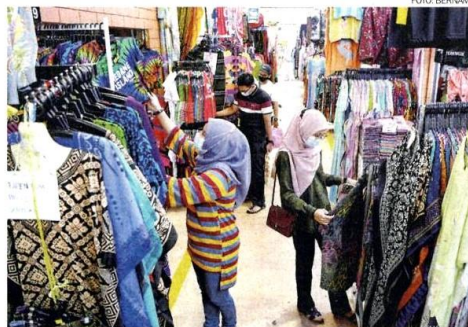
Pelancong tempatan berkunjung ke Pasar Besar Kedai Payang bagi mendapatkan pelbagai jenis kain serta baju bercorak batik Terengganu.