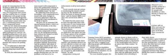
Abused A car is parked in a blue designated parking bay at a Texas Chicken restaurant.