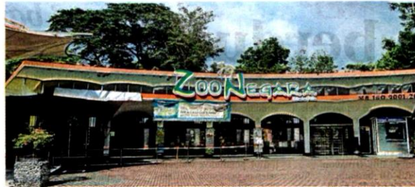
BANJIR kilat menyebabkan jalan dalam kawasan zoo rosak teruk dan lumpur memenuhi kandang haiwan.

zoo dan hanya seekor kambing saja dikesan mati dalam kejadian banjir kilat ini,"