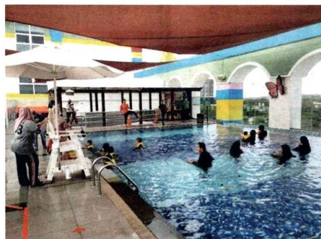
Orang ramai memanfaatkan cuti hujung minggu mereka bersama ahli keluarga di Hotel Legoland, Iskandar Putri, Johor selepas pengumuman kebenaran merentas daerah dan negeri pada minggu lalu.

"La perkembangan positif kepada sektor pelancongan di negeri ini terutama bagi penduduk setempat," katanya.