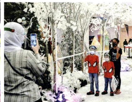
Para pengunjung kelihatan bergambar di sebuah pusat beli-belah yang dihiasi hiasan bertemakan Krismas dan beberapa maskot berkostum bertemakan watak susana Krismas menjelang sambutan Hari Natal di sekitar ibu negara pada Ahad.

Rakyat bercuti dan membeli-belah sempena kelonggaran rentas daerah dan negeri